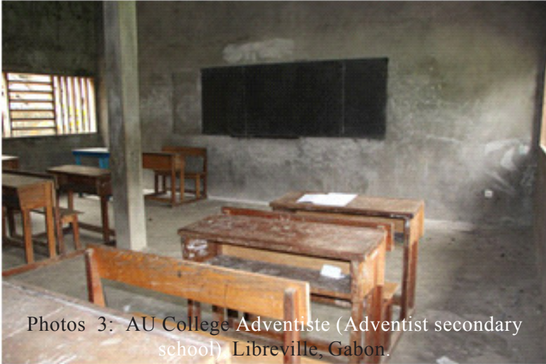
Photos 3: AU College Adventiste (Adventist secondary school) Libreville, Gabon.

Chhiartu 1: AYM-a ka tel vêna zârah ka nungchangah danglamna a lo awm a. Tûnah chuan kan chênna vêla mîte ðanpuitu nih ka châk a, a bik takin upa lamte ðanpui ka duh a ni. Chibai bûk te, an ip khâisak te leh zahna lantîr hrim hrim pawh ka duh a ni.